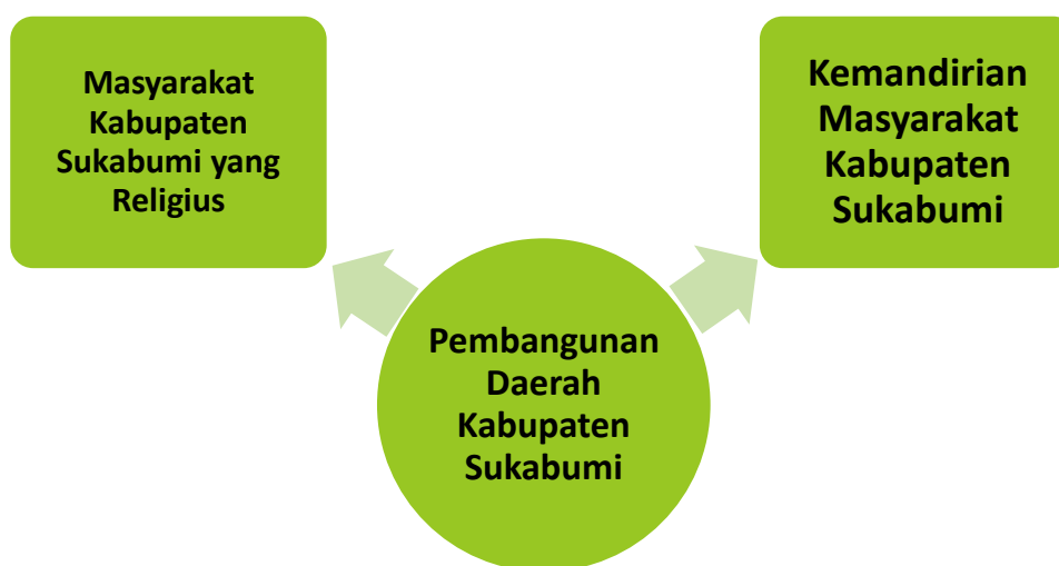
Gambar 3.1 Hubungan Antar Elemen Visi Pembangunan Kabupaten Sukabumi

maka dapat ditelaah bahwa kepala daerah ingin membangun Kabupaten Sukabumi menjadi lebih baik dengan tetap mempertahankan moral religiusitas dan kemandirian masyarakat seperti yang tergambar pada gambar berikut.